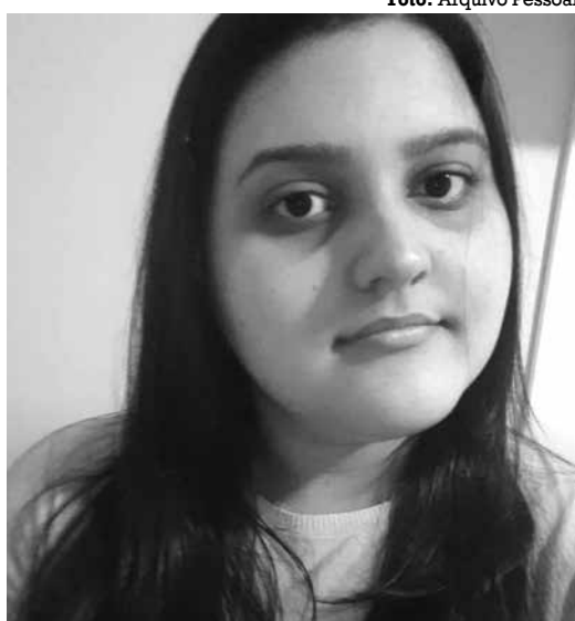
Izadora: preferência por motorista mulher