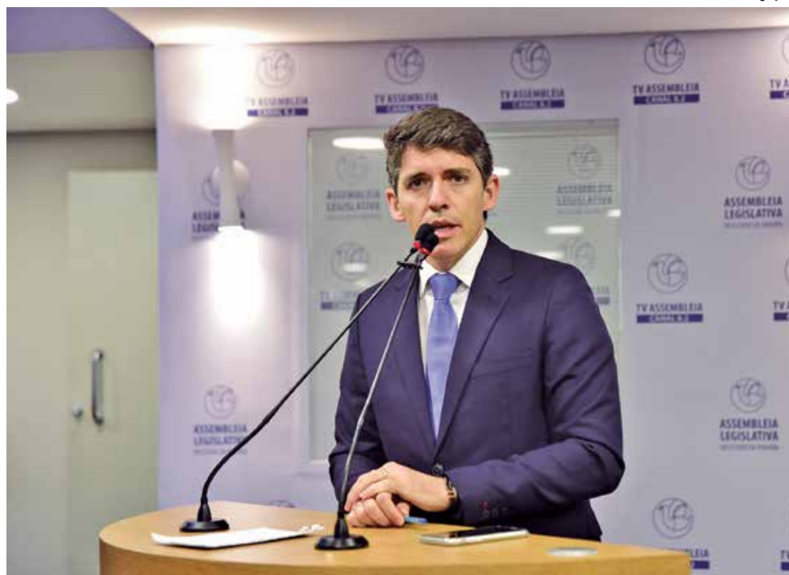
Tovar disse que a situação de carência de água é muito delicada e requer uma solução urgente