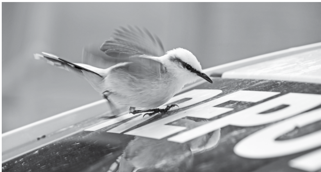
Brigando com a própria sombra!