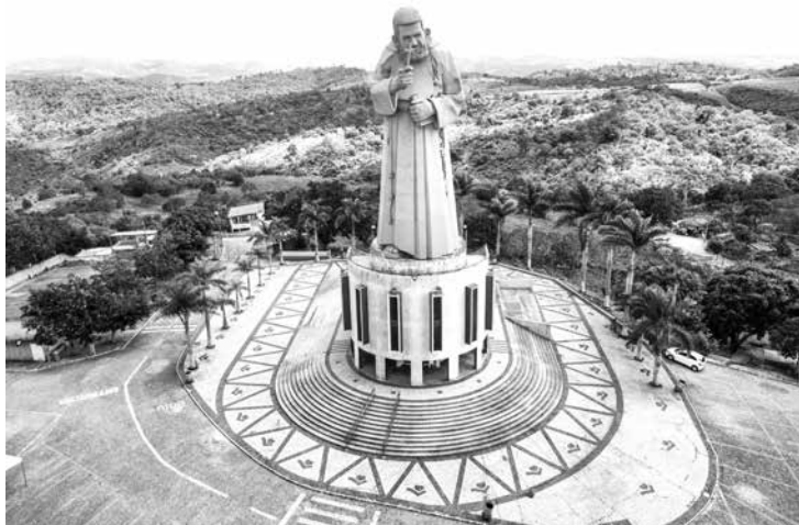
Festa celebrará os 135 anos da rainha do Brejo paraibano

A Rota Cultural Raízes do Brejo acontece neste fim de semana, no município de Guarabira, pela primeira vez, cujo tema é “Cultura, Fé e Poesia na Rainha do Brejo”. Prestes a completar 135 anos, Guarabira inicia as festividades com a Rota na sexta-feira (25) e se estende até o domingo (27). Durante a Rota, no sábado (26), também será celebrada a emancipação política da cidade, destacando as potencialidades da “Cidade Luz” como turismo, lazer e cultura.