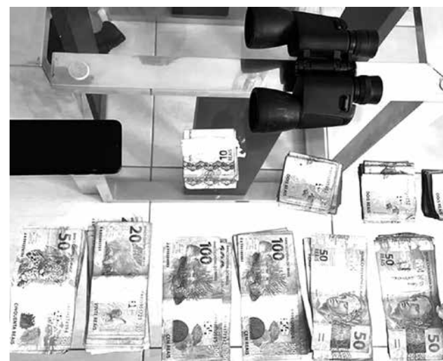
Binóculos e dinheiro foram apreendidos na operação