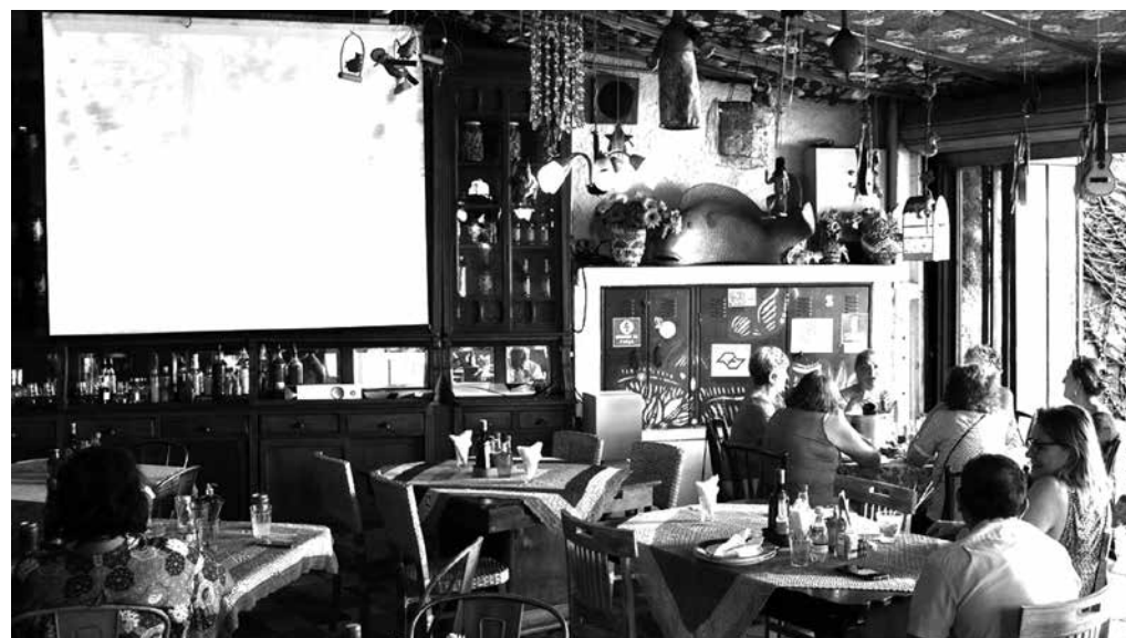
Pesquisa indica que 45% dos restaurantes vão transmitir os jogos da Seleção Brasileira