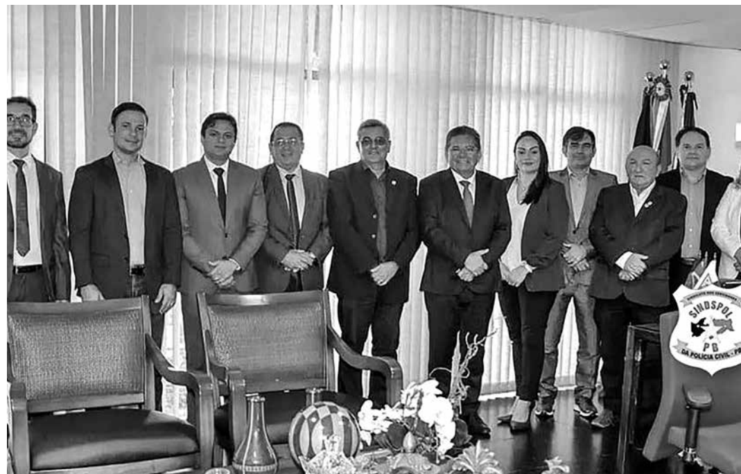
Parlamentares e representantes dos policiais comemoraram a publicação do PCCR

de vagas para a promoções e progressões; avaliação de desempenho para todas as promoções criando incentivos nas carreiras; equiparação de remuneração das carreiras investigativas e técnica científica.