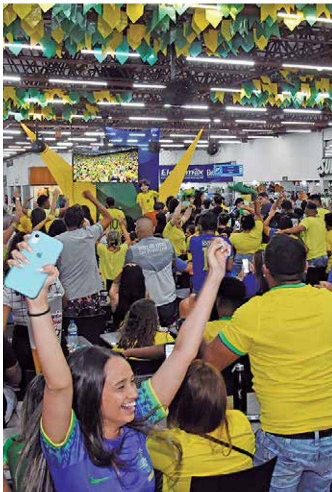
As áreas de lazer foram tomadas por homens, mulheres, jovens e crianças que vibraram com as emoções da vitória da Seleção

As emoções estavam voltadas para o segundo tempo e a galera foi à loucura quando o atacante Richarlyson pegou