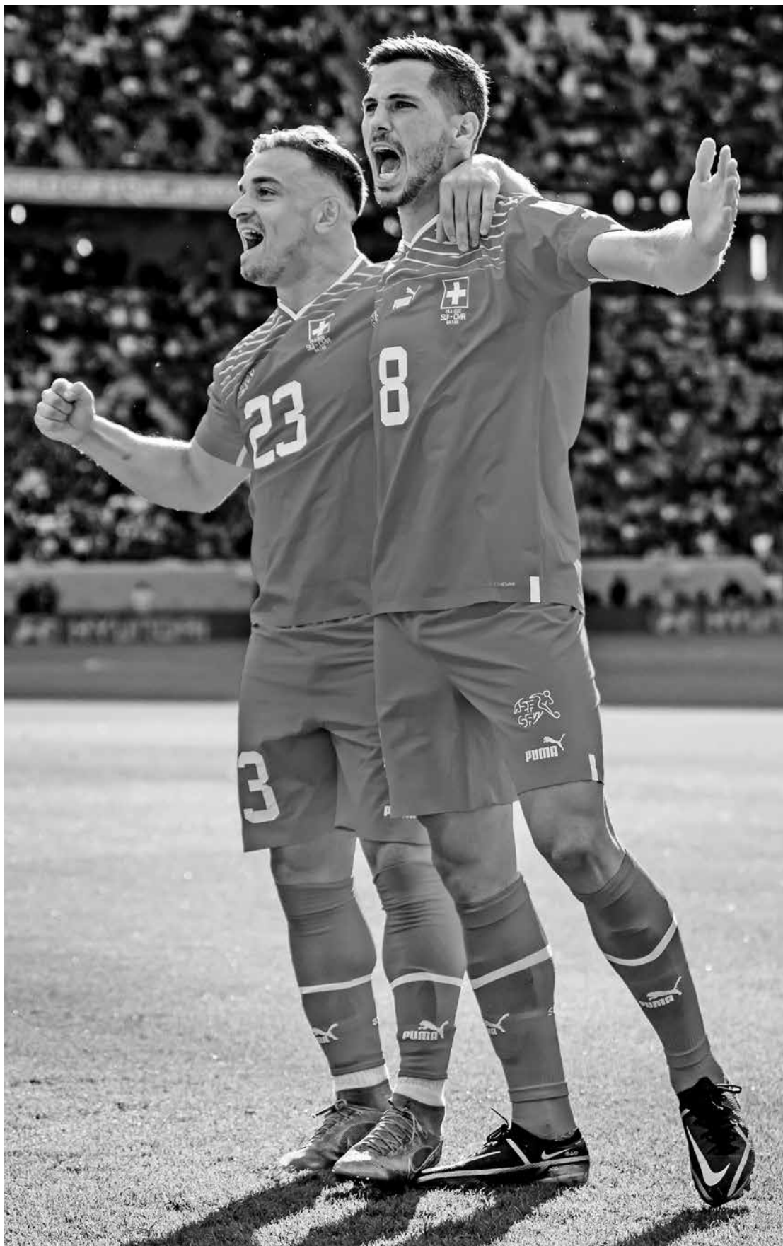
Os jogadores suíços Xherdan Shaqiri e Remo Freuler comemoram o gol da vitória sobre Camarões

Aos 14, Choupo-Moting se aproveitou de cochilo da zaga, tomou a bola e ficou livre para marcar, mas acabou finalizando fraco e parou na defesa de Sommer. Enquanto isso, o adversário tentava levar algum perigo em contra-ataques.