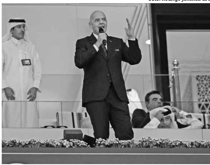
Infantino discursando no jogo de abertura da Copa no Qatar

Anteriormente, Hoeness chegou a defender a realização da Copa no Qatar, assim como o patrocínio de uma companhia aérea do país ao Bayern de Munique, o que gerou protestos de sócios do clube.