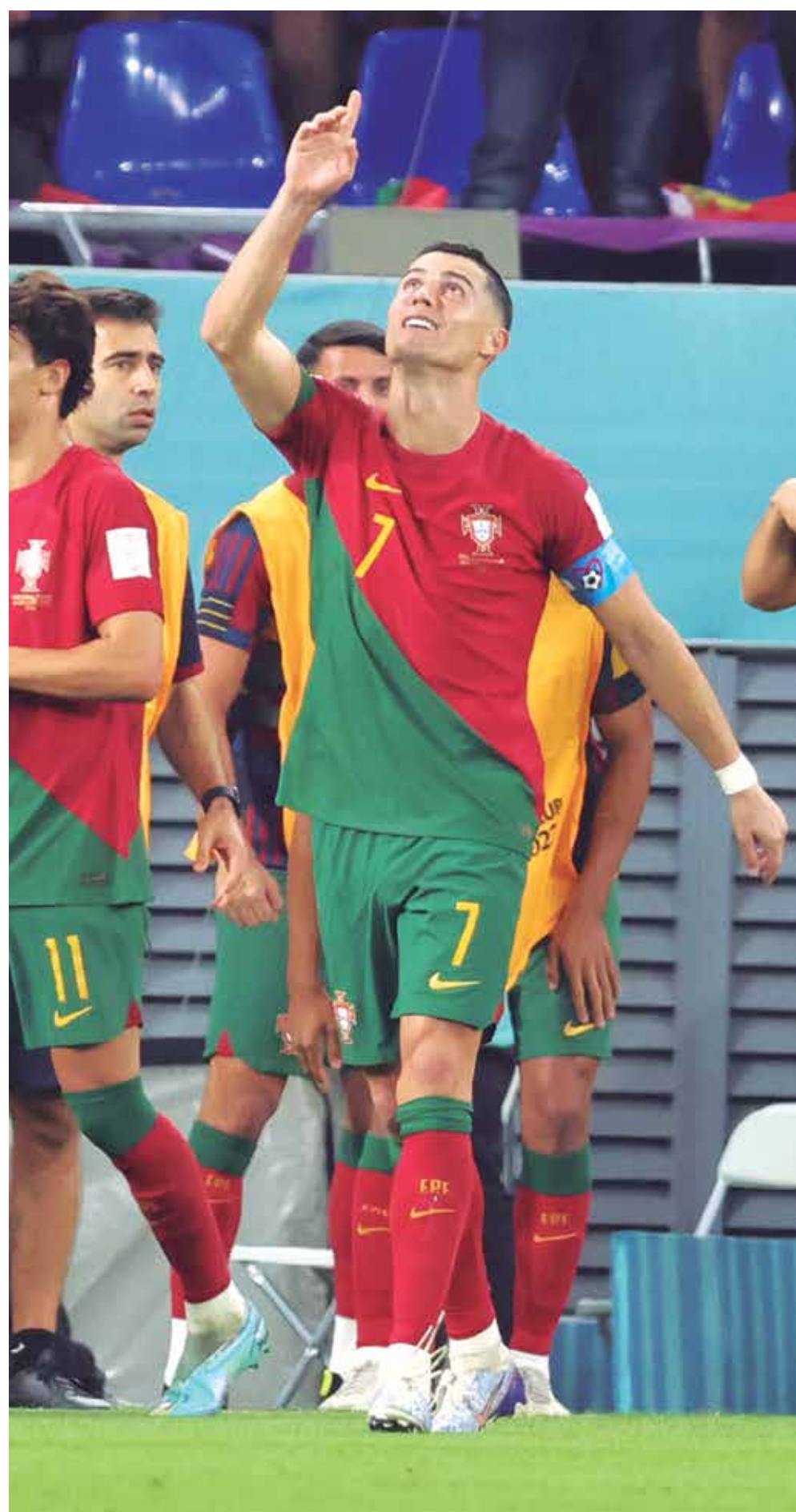
Cristiano Ronaldo agradece a Deus por marcar na estreia da Copa e bater um novo recorde

Em entrevista após o duelo com os ganeses, CR7 afirmou, em relação à conturbada e recente saída do Manchester United, que se trata de "um capítulo fechado" e que está concentrado "exclusivamente na Copa do Mundo."