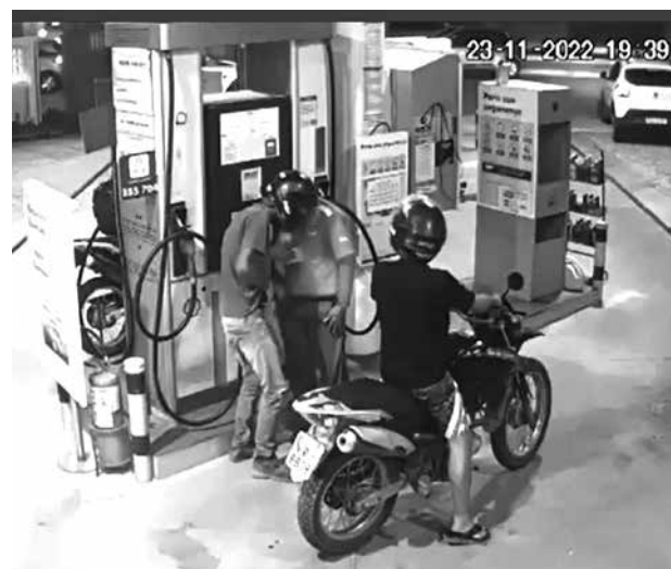
Imagens mostram o momento do assalto no posto

do na Avenida Ex-combatente Assis Luiz, no bairro João Paulo II, já foi vítima de assaltos por cerca de dez vezes e os ladrões sempre estão em motos. Guarnição da Polícia Militar esteve no local, recebeu as informações, realizou rondas, no entanto, não conseguiu, até o final da tarde de ontem, localizar a dupla de assaltante.